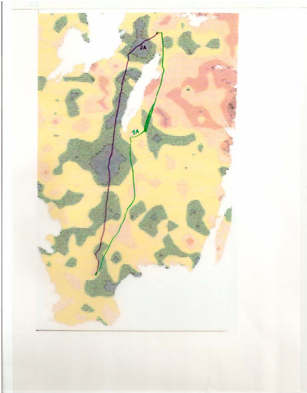
Fig 2. Möjliga sträckningar väster respektive öster om Vättern (ej exakt ritade).

Om man placerar två av de tänkta alternativen på ledningssträckorna på föregående bild kan man se att de passerar kopparfattiga åkrar och åkrar med medelvärden på kopparhalterna. Inget område med höga eller extremt höga värden på kopparhalter kommer att passeras, se fig 2.