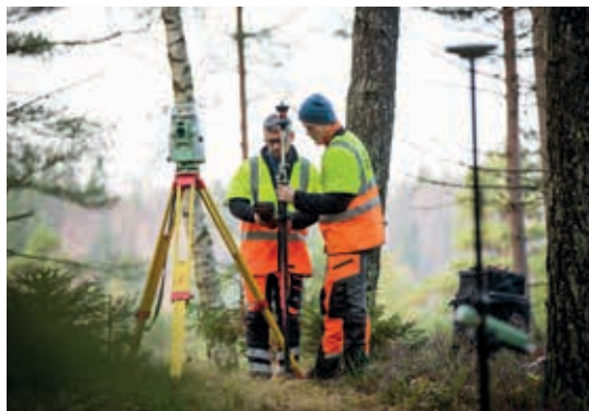
Här mäter entreprenören Sweco ut placeringen av vinkelstolpar.

Arbetet med att undersöka var vinkelstolpar längs linjen för den planerade ledningssträckningen skulle kunna stå har pågått under hösten och vintern. En vinkelstolpe placeras där ledningen behöver byta riktning. t.ex. för att vika av från bostadshus eller naturvärden. Arbetet kommer att slutföras under hösten när ledningens sträckning är mer definierad.