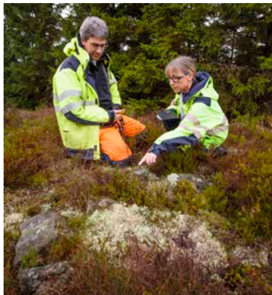
Graven hittades i Hjärtum socken i Lilla Edets kommun. Tidsperioden för bronsåldern var 1800–500 f.Kr.