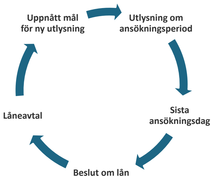
Figur 1 Process för nätförstärkningslån till elnätsföretag för att underlätta anslutning av produktion av förnybar el.

Regeringens ambition är att ersätta övergångslösningen med en långsiktig marknadslösning där staten inte behöver ta en finansiell risk.