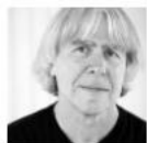
Av Svenolof ...

Deadline närmar sig i de pågående förhandlingarna om balanshanteringen mellan de nordiska systemoperatörerna. Ett scenario är att det nordiska samarbetet spricker för gott.